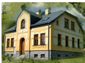
Budovy Horní Maxov