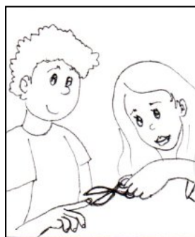
POMOC PŘI HYGIENĚ