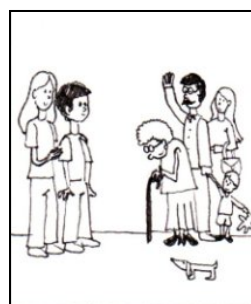
KONTAKT S RODINOU