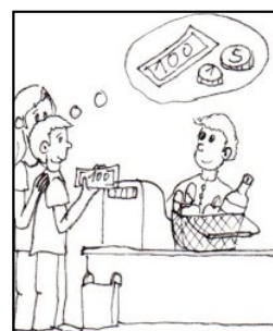
HOSPODAŘENÍ S PENĚZI - NÁKUPY