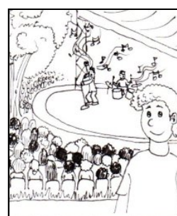
KONTAKT S BĚŽNÝM PROSTŘEDÍM