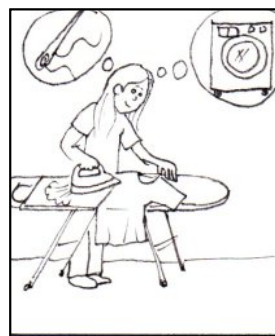
PRANÍ DROBNÉ OPRAVY PRÁDLA