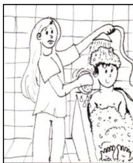
POMOC PŘI HYGIENĚ