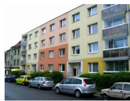
Budova Jablonec nad Nisou