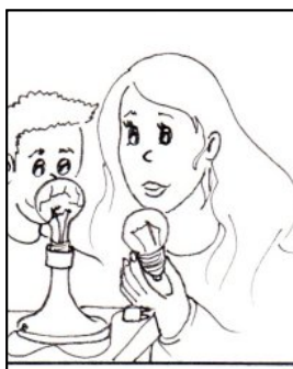
DROBNÉ OPRAVY SPOTŘEBIČŮ