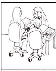
PRÁVA A OPRAVNĚNÉ ZÁJMY