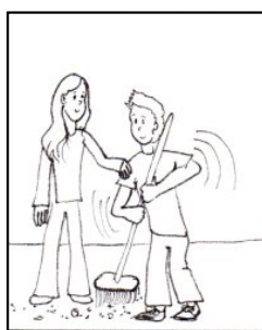
PRACOVNĚ VÝCHOVNÁ ČINNOST